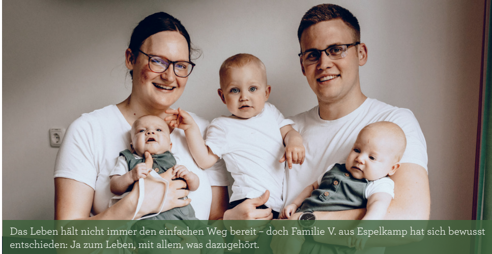
Das Leben hält nicht immer den einfachen Weg bereit – doch Familie V. aus Espelkamp hat sich bewusst entschieden: Ja zum Leben, mit allem, was dazugehört.