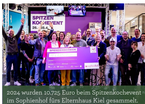
2024 wurden 10.725 Euro beim Spitzenkochevent im Sophienhof fürs Elternhaus Kiel gesammelt.