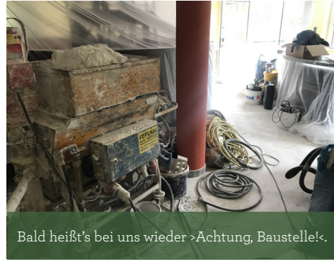
Bald heißt's bei uns wieder >Achtung, Baustelle!< .

Deshalb heißt es im Frühjahr 2025 erneut >Achtung, Baustelle: Ein schönes Zuhause von Anfang an!< . Unser Aachener Ronald McDonald Haus ist bereits un-