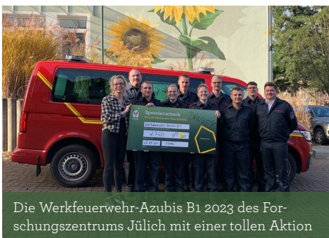
Die Werkfeuerwehr-Azubis B1 2023 des Forschungszentrums Jülich mit einer tollen Aktion

Haben auch Sie eine Idee? Dann melden Sie sich sehr gern bei uns! •