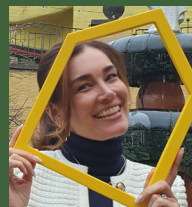
Jana Ina Zarrella