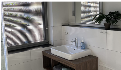
Mittlerweile schon sieben Monate alt: unsere neuen Bäder!

Ein neuer Turbostaubsauger? Kein Problem für Diversey (Solenis) und Mitarbeiter Denny Scheckert, der ihn in der Mittagspause vorbeibrachte und spendete. Das Team von GlaxoSmithKline freute sich auf den jährlichen >Together Day<, um im Elternhaus vier Etagen und alle Gemeinschaftsräume weihnachtlich zu schmücken – eine große Arbeitserleichterung für das Elternhaus-Team.