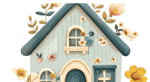
Ein neues und stabiles Gartenhaus für das Ronald McDonald Haus

Unser Garten braucht Ihre Hilfe! Für Eltern ist er ein Ort zum Krafttanken, für Patienten- und Geschwisterkinder ein Abenteuerspielplatz. Damit er aber neu zum Erblühen kommt, wollen wir einiges umgestalten und brauchen ein neues Gartenhaus und neue Gartenmöbel. Wenn Sie unser Garten-Engel werden möchten und uns mit einer Spende unterstützen, wäre das fantastisch. •