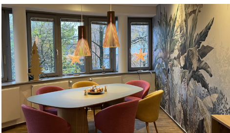
Dank einer Zuwendung aus einem Testament konnten wir unser TV-Zimmer neu gestalten.

Ähnlich verhielt es sich auch, als im Herbst und rechtzeitig vor Halloween das siebenköpfige Team von Capgemini kam, um einen Tag lang Büsche zu schneiden, Laub zu harken und 300 Blumenzwiebeln zu setzen. Zum Schluss wurden noch Kürbisse geschnitzt und eine leckere herbstliche Suppe gekocht, mit der die Familien im Ronald McDonald Haus den Tag entspannt ausklingen lassen konnten.