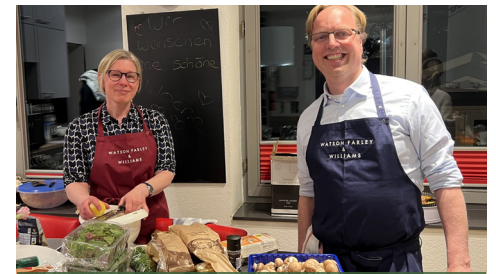
Anwälte von Watson, Farley & Williams spendeten und kochten für Familien.