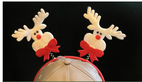
Weihnachtsstimmung kam auf durch das Team von GlaxoSmithKline.