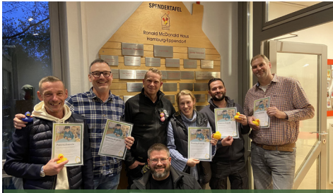
Sie haben nicht nur alle Bäder saniert, sondern auch gemeinsam eine Patenschaft übernommen.