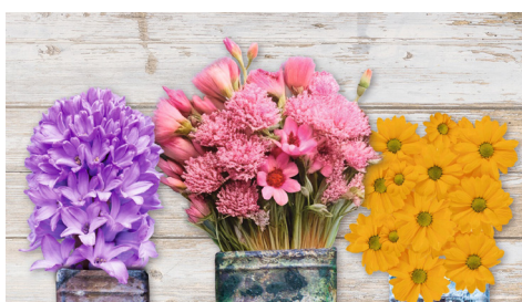
Ein blühender Garten für Familien schwer kranker Kinder

Unser Garten braucht Ihre Hilfe! Für Eltern ist er ein Ort zum Krafttanken, für Patienten- und Geschwisterkinder ein Abenteuerspielplatz. Damit er aber neu zum Erblühen kommt, wollen wir einiges umgestalten und brauchen ein neues Gartenhaus und neue Gartenmöbel. Wenn Sie unser Garten-Engel werden möchten und uns mit einer Spende unterstützen, wäre das fantastisch. •