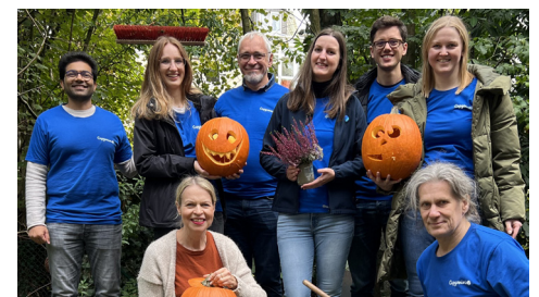
Capgemini machte den Garten winterfest und bereitete Halloween vor.

Ähnlich verhielt es sich auch, als im Herbst und rechtzeitig vor Halloween das siebenköpfige Team von Capgemini kam, um einen Tag lang Büsche zu schneiden, Laub zu harken und 300 Blumenzwiebeln zu setzen. Zum Schluss wurden noch Kürbisse geschnitzt und eine leckere herbstliche Suppe gekocht, mit der die Familien im Ronald McDonald Haus den Tag entspannt ausklingen lassen konnten.