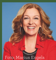
Bettina Tietjen