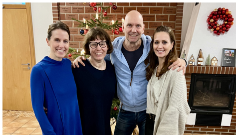
Eine wunderbare Weihnachtsaktion!

Unser Kölner Zuhause auf Zeit ist nun die Herzensangelegenheit vom WECON Netzwerk Köln II. Zu Weihnachten erhielten die Familien liebevoll gepackte Tüten mit Geschenken, Festtagslebensmitteln und Wellnessprodukten. Und das war erst der Anfang etlicher toller Aktionen! Im März kamen viele Mitglieder unserer