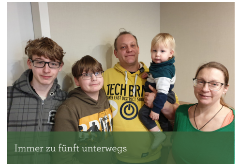
Immer zu fünft unterwegs