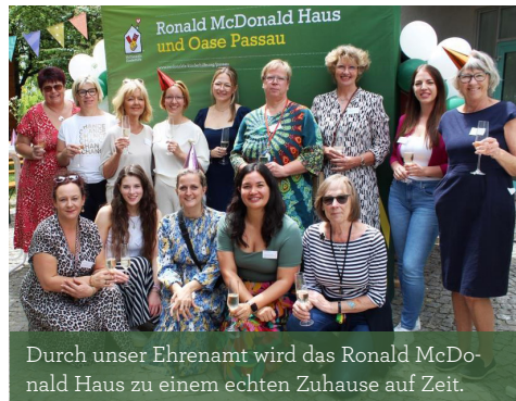
Durch unser Ehrenamt wird das Ronald McDonald Haus zu einem echten Zuhause auf Zeit.