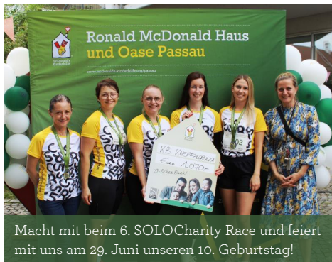
Macht mit beim 6. SOLO Charity Race und feiert mit uns am 29. Juni unseren 10. Geburtstag!

die Familien nicht nur eine Unterkunft sein durften, sondern ein echtes Zuhause auf Zeit. Gemeinsam mit unseren wertvollen, ehrenamtlichen Kolleginnen konnten wir unsere Familien von der ersten Aufnahme bis zum Heimgehen begleiten. Unzählige Geschichten, bewegende Szenen der Freude und großer Zusammenhalt prägten die letzten 10 Jahre. Für diese Erfahrung sind wir sehr dankbar. Dankbar auch Ihnen, denn Sie sind es, die diesen wichtigen Ort hier erst möglich machen – durch besondere Netzwerke, an denen Sie uns profitieren lassen, die monetäre Unterstützung, die uns das Leben leichter macht, oder einfach mit Ihrer Präsenz, mit der Sie uns spüren lassen, dass Sie an unserer Seite sind und unsere Familien hier im Passauer Ronald McDonald Haus auf Sie zählen dürfen. Sie machen unser Elternhaus einzigartig.