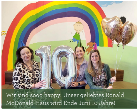
Wir sind sooo happy: Unser geliebtes Ronald McDonald Haus wird Ende Juni 10 Jahre!

Mit großer Dankbarkeit und echter Demut im Herzen dürfen wir auf die letzten 10 Jahre zurückblicken, in denen wir für