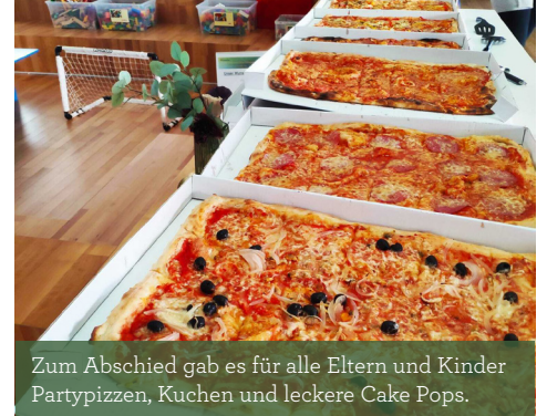
Zum Abschied gab es für alle Eltern und Kinder Partypizzen, Kuchen und leckere Cake Pops.

Viele Freundschaften schloss die kleine Familie während ihrer Zeit im Elternhaus. Hier war Platz, um sich auszutauschen, sich gegenseitig Mut zu machen und auch in schwierigen Phasen füreinander da zu sein. Hunderte andere Familien sahen die drei während ihrer 519 Tage im Ronald McDonald Haus kommen und gehen – und mussten doch selbst auf ihren großen Moment und die erlösenden Worte ›Ihr dürft nach Hause!‹ warten. Doch am 25. Januar war es dann schließlich so weit: Nach erfolgreicher Therapie konnte die Reise zurück nach Zypern endlich angetreten werden.